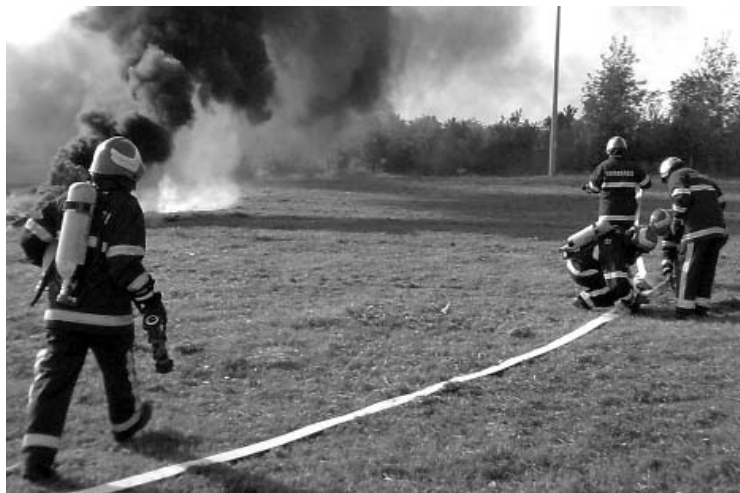
Stalna obuka i sudjelovanje na natjecanjima omogućava potrebnu spremnost vatrogasaca

društava svakako je DVD Kršinci. Njihov plan je da ove godine završe ranije započetu sveobuhvatnu obnovu i uređenje doma u Kršincima. Inače, i njihov vozni park se krajem