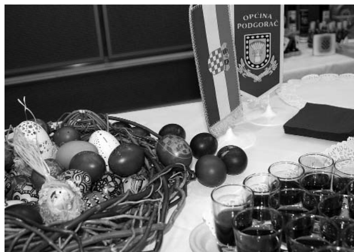
Sve je bilo u znaku predstojećeg blagdana Uskrsa