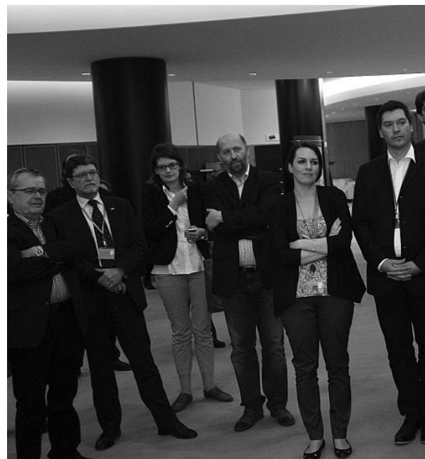
Brojni zastupnici i euro-diplomati došli su vidjeti Podgorač

Kada se prostranim holovima zgrade Europskog parlamenta u Bruxellesu zapjevalo i zaszviralo »Podgoračke uske staze«, istoga su trena nestale sve višetjedne treme i nervoze o tome kako će ispasti izložba, nastup, uskršni stol, učenički crteži, putovanje, avioni, smještaj, doprema stotinjak izložbenih eksponata, hrane i nošnji i mali milijun drugih sitnica i krupnica koje su trebale činiti prvo predstavljanje Općine Podgorač i HKD-a Podgoračani u Europskom parlamentu.