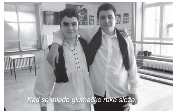
Kad se mlade glumačke ruke slože.