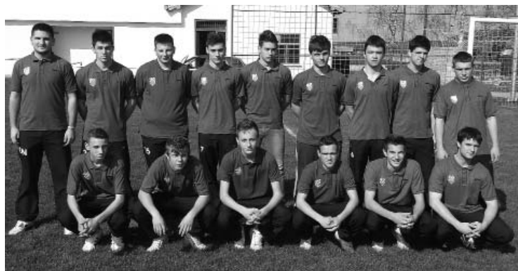
Juniori Mladosti u novim dresovima