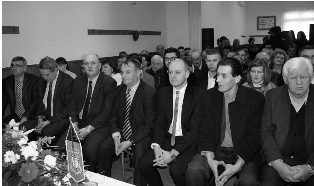
Brojni odaziv uglednih gostiju