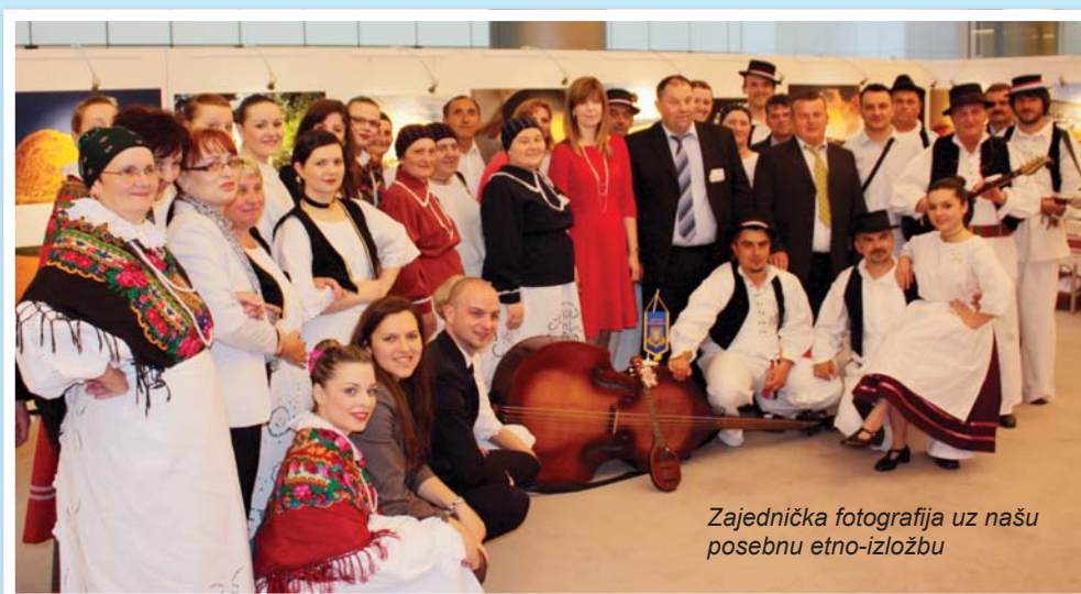
Zajednička fotografija uz našu posebnu etno-izložbu