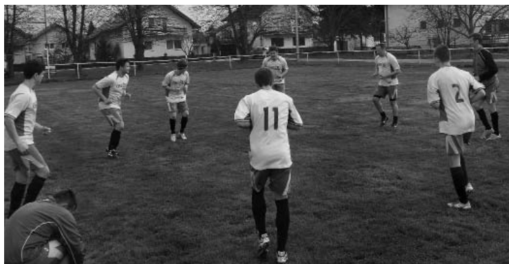
Mladostašima ovoga proljeća treba nešto više zagrijavanja