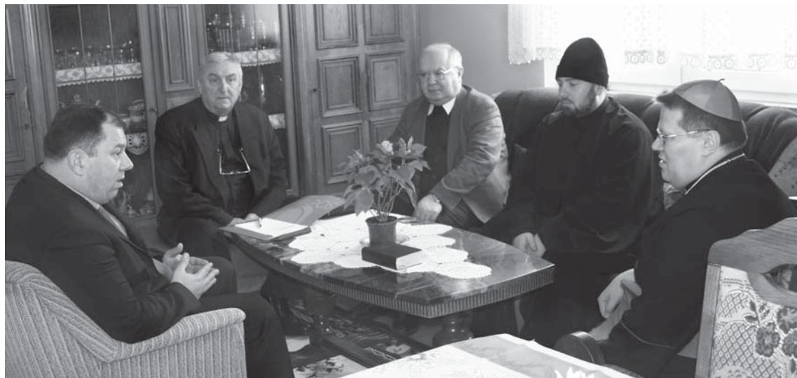
Razgovori predstavnika općinske i vjerskih vlasti u Budimcima