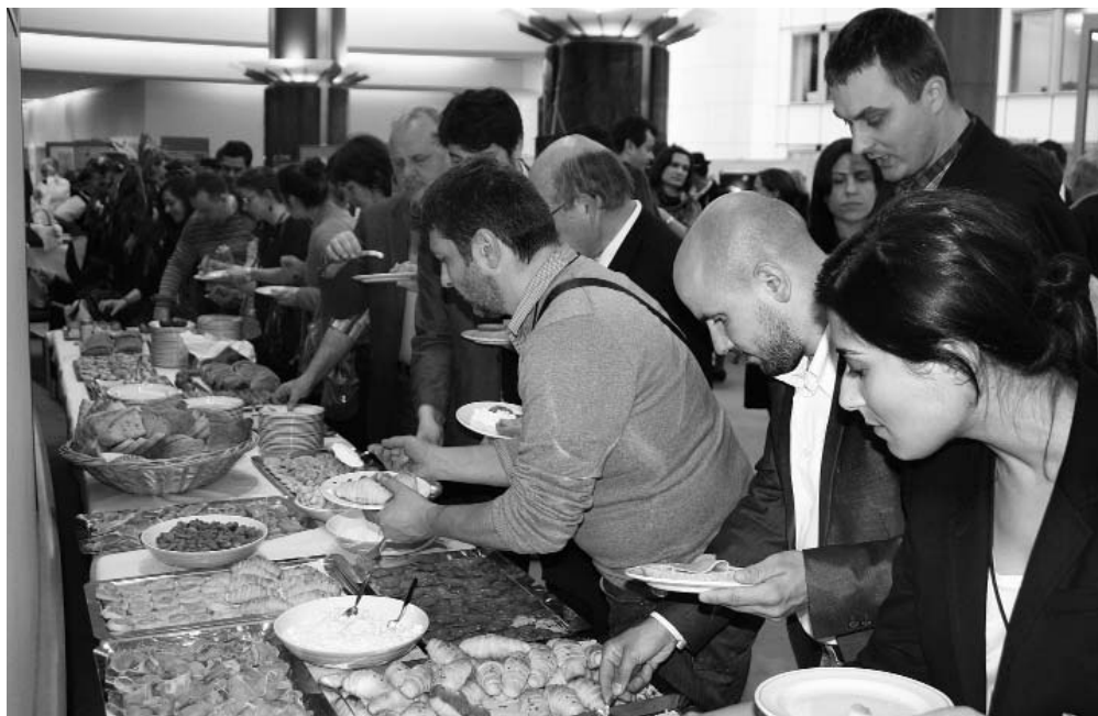
Slavonske uskrсне delicije brzo su 'planule'