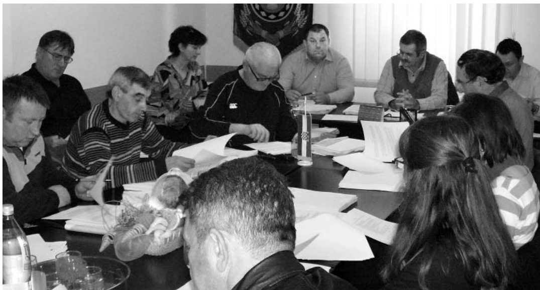
Općinski vijećnici usvojili su niz odluka i odobrili sredstva za brojne programe u 2014. godini