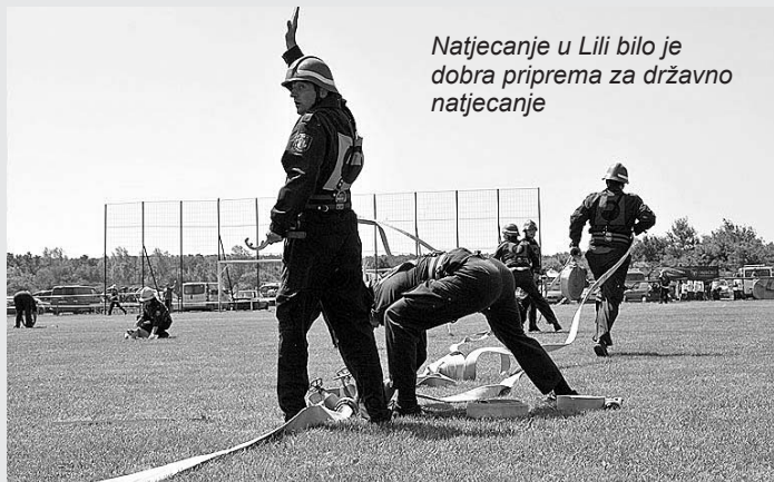
Natjecanje u Lili bilo je dobra priprema za državno natjecanje

S obzirom na ostvarene rezultate, na državnom natjecanju za seniorske kategorije u Zadru, natjecat će se dvije vatrogasne ekipe s područja općine Podgorač.