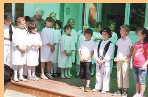
Nije lako nastupati pred tolikom publikom

Uz čestitke za postignute uspjehe, općinski načelnik Goran Đanić (HNS) u svom je obraćanju najavio skori početak radova na izgradnji školske dvorane. Kako je rekao, uz potporu ministra graditeljstva Ivana Vrdoljaka , radovi bi trebali početi u rujnu.