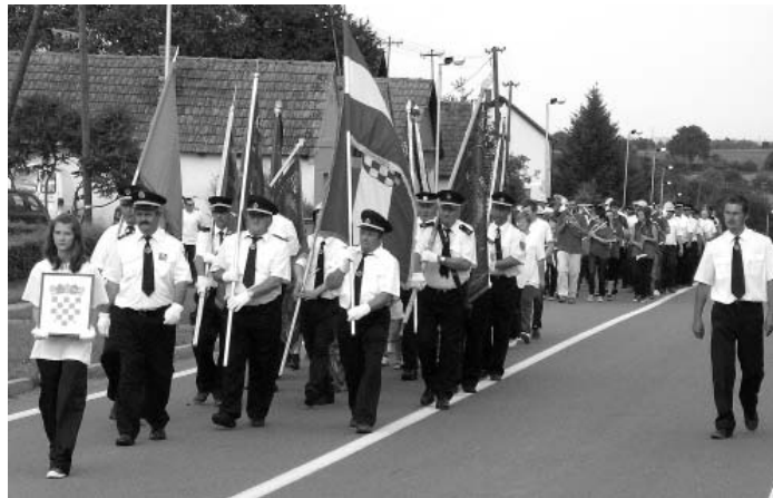
Svečani mimohod kroz Stipanovce