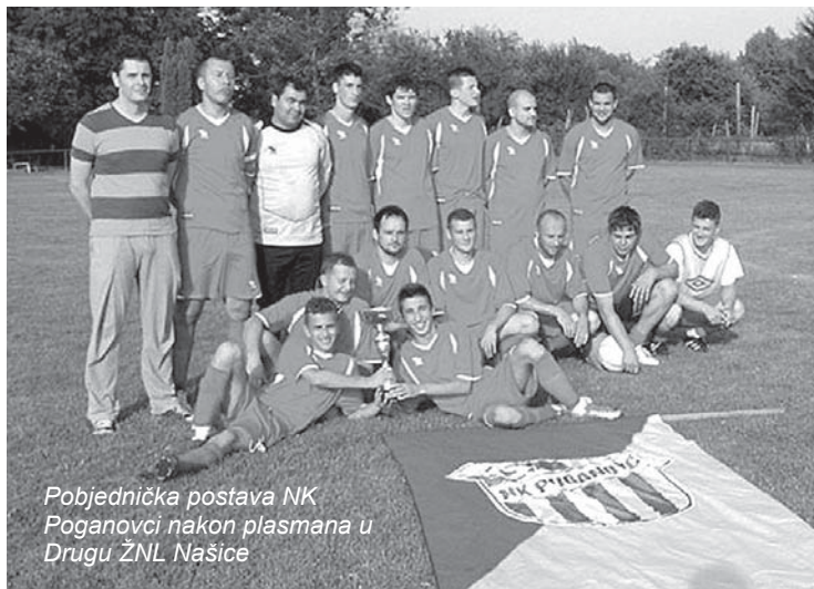
Pobjednička postava NK Poganovci nakon plasmana u Drugu ŽNL Našice

Oživljavanjem rada nogometnog kluba, stalnim utakmicama, treninzima, uređivanjem klupskih prostora i svim aktivnostima koje idu uz ovakvu sportsku, ali i društveno korisnu aktivnost – živnuo je i cijelo selo. Natjecanje kluba u Drugoj ligi donijet će još više događanja i zasigurno još veće zanimanje mještana. To više jer će klub uskoro postati i okuplja-lište mlađih, koji će se angažirati u pionirskoj sekciji.