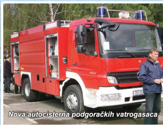
Nova autocisterna podgoračkih vatrogasaca