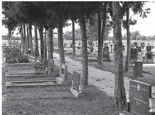
Na budimačkom groblju će se ukloniti šest stabala

Opskrba stanovništva pitkom vodom obavljat će se novom vatrogasnom autocisternom. Svi koji su zainteresirani za dovoz vode svoje potrebe mogu prijaviti u prostorijama Općine Podgorač. Prijave za dovoz vode zaprimat će se u Općini Podgorač svaki radni dan u vremenu od 8.00 do 14.00 sati na broj telefona 698-274. Domaćinstva će DVD-u Podgorač na licu mjesta putem opće uplatnice plaćati 70 kuna za pola cisterne (3.500 litara).