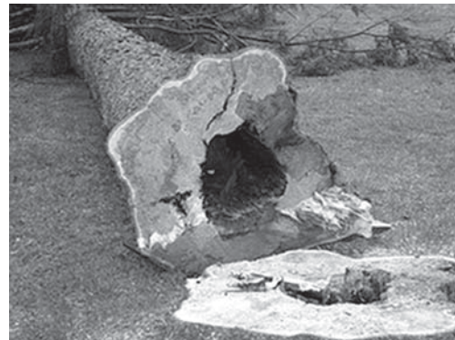
Posebno su opasna trula i bolesna stabla