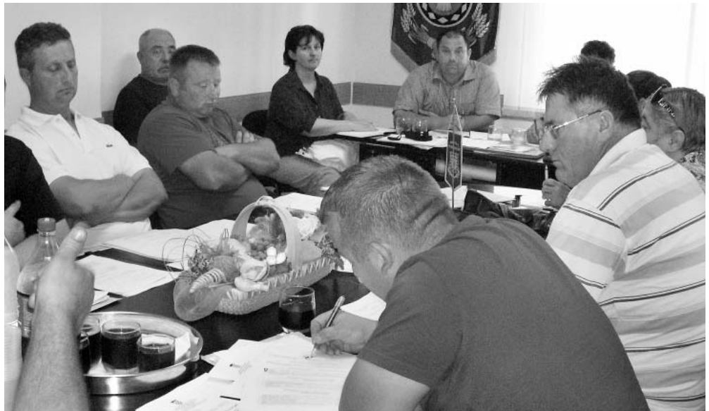
Općinski vijećnici usvojili su niz odluka u cilju kvalitetnijeg života mještana

Vijećnici su nadalje usvojili Godišnji izvještaj o izvršenju Proračuna Općine Podgorač za prošlu godinu, a donijeli su i Odluku o zakupu i kupoprodaji poslovnog prostora