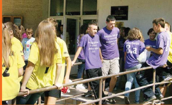
Podgorački osmaši – njihovi posljednji školski dani