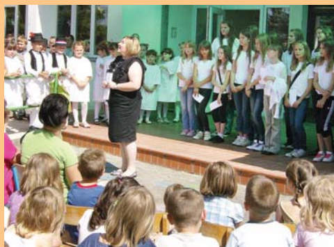
Ravnateljica čestita svima nagrađenima

Inače, Dan škole je sjajna prigoda da se istaknu oni koji su protekle školske godine