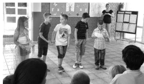
Detalj s ovogodišnje završne priredbe za učenike i roditelje