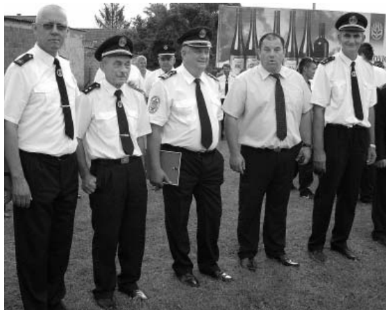
Vatrogasni čelnici s načelnikom Općine G. Đanićem