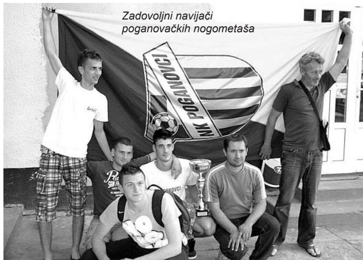
Zadovoljni navijači poganovačkih nogometaša