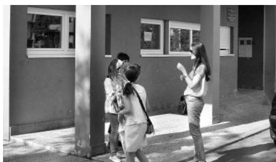
Nova školska zgrada PŠ Budimci

Nastava se za prva četiri razreda odvija u dvije smjene, a stariji učenici (od 5. do 8. razreda) nastavu pohađaju u matičnoj