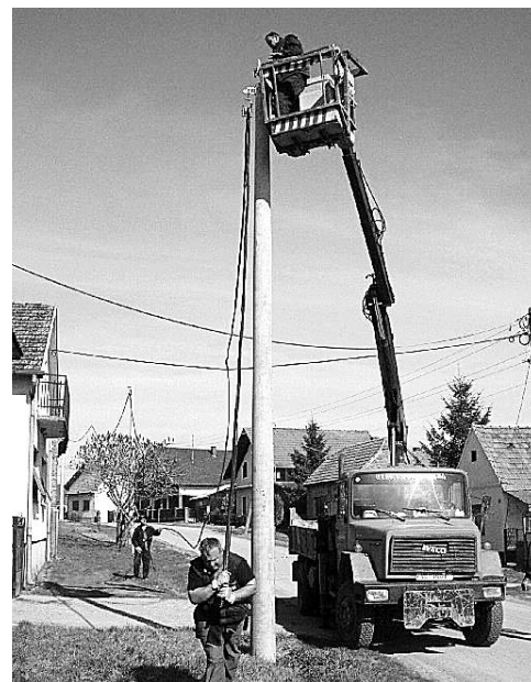
Tko bude želio, od jeseni sljedeće godine moći će se grijati 'na plin'

- Temeljita obnova niskonaponske mreže, prema sadašnjem planu investicija, predviđena je za naselja Kršinci, Budimci i Poganovci. Projektna dokumentacija za