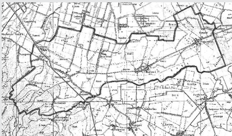
Proizvodnja i cijevni transport nafte i plina (PPOBŽ)

Prema Prostornom planu Osječko-baranjske županije utvrđeni su mnogi kriteriji u vezi s izgradnjom plinoopskrbnog sustava općine Podgorač. Tako je planirana izgradnja mjerno-redukcijske stanice (MRS) Podgorač, iz koje će se područje općine opskrbljivati zemnim plinom.