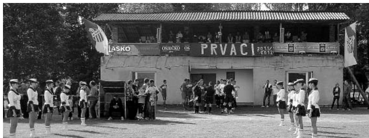
Fešta na poganovačkom "Stadionu Berečak" nakon osvajanja prvog mjesta

Našice sigurno nećemo 'plesati samo jedno ljeto' – kaže Lazić.