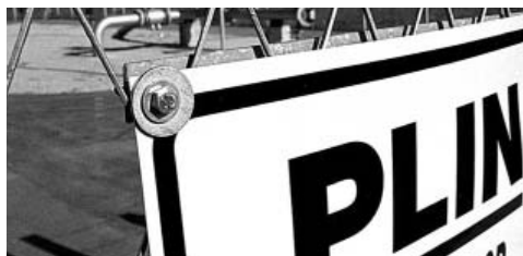
Uskoro će ovakvi radovi početi u Kršincima, Budimcima i Poganovcima