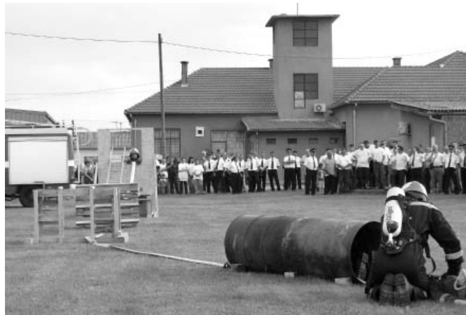
Pokazna vježba u dvorištu Vatrogasnog doma