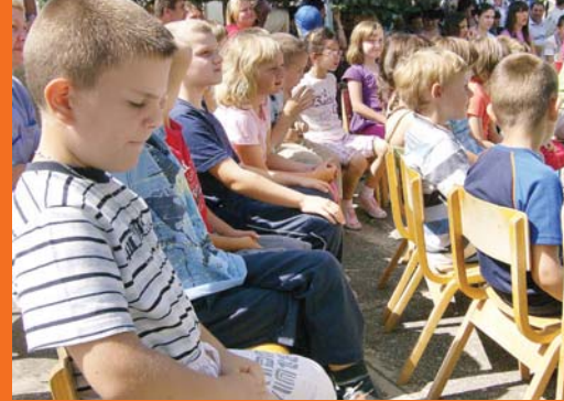
Podgorački vrtičarci – njih tek očekuju školski dani