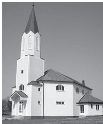
Župna crkva Presvetog Trojstva u Budimcima

Nedugo nakon njihova doseljavanja ustanovljena je župa i izgrađene su katoličke crkve Presvetog Trojstva u Budimcima i sv. Ivana Nepomuka u Poganovcima. Crkve nose iste nazive kakve su imale u mjestima ranijeg življenja ovih vjernika. Kako kaže velečasni Petrović, u uspomenu na svoj