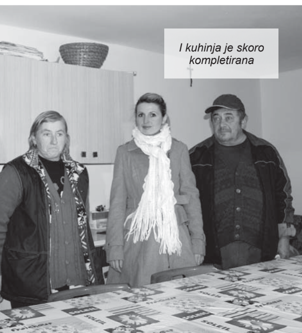
I kuhinja je skoro kompletirana

Stoga svi oni imenovani i neimenovani dobri ljudi koji su Nemetovima priskučili u pomoć, zaslužuju jedno ogromno ljudsko HVALA!