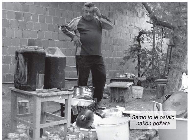
Samo to je ostalo nakon požara

Noć s petka na subotu, između 20. i 21. rujna 2013. godine, svi članovi obitelji Nemet iz Razbojišta, zasigurno će pamtili cijeloga života. Nezaustavljivi požar bukvalno je progutao staru obiteljsku kuću izgrađenu davne 1932. godine. Ne samo što im je time u samo nekoliko sati nestala najvrednija obiteljska imovina, nego su te nesretne noći bukvalno ostali bez krova nad glavom i bez svega što jedna obitelj prikuplja desetljećima.