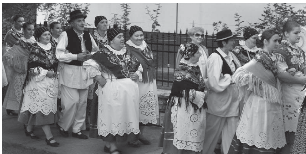
Podgoračani znaju vrednovati tradiciju

- Nakon 23 godine postojanja i ustrajnog rada na organizaciji, ovakav događaj i veliki odaziv kulturno-umjetničkih društava iz čitave regije, najbolji je pokazatelj kako je ovo velika ve-