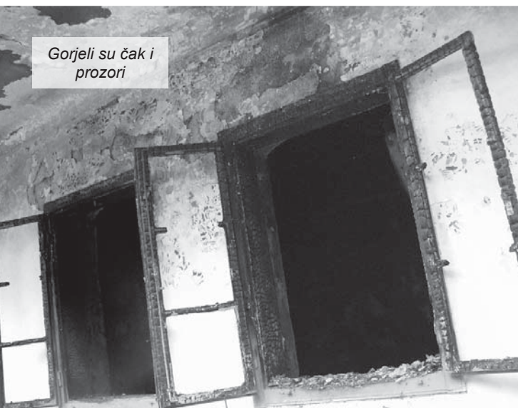
Gorjeli su čak i prozori