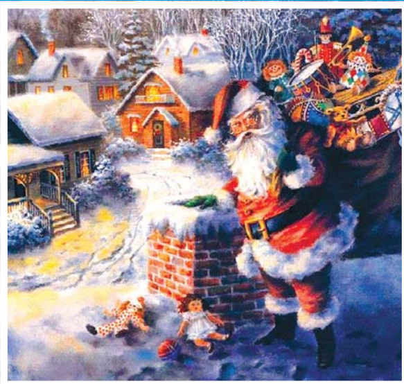
Seoska zimska idila – crtež s početka 20. stoljeća