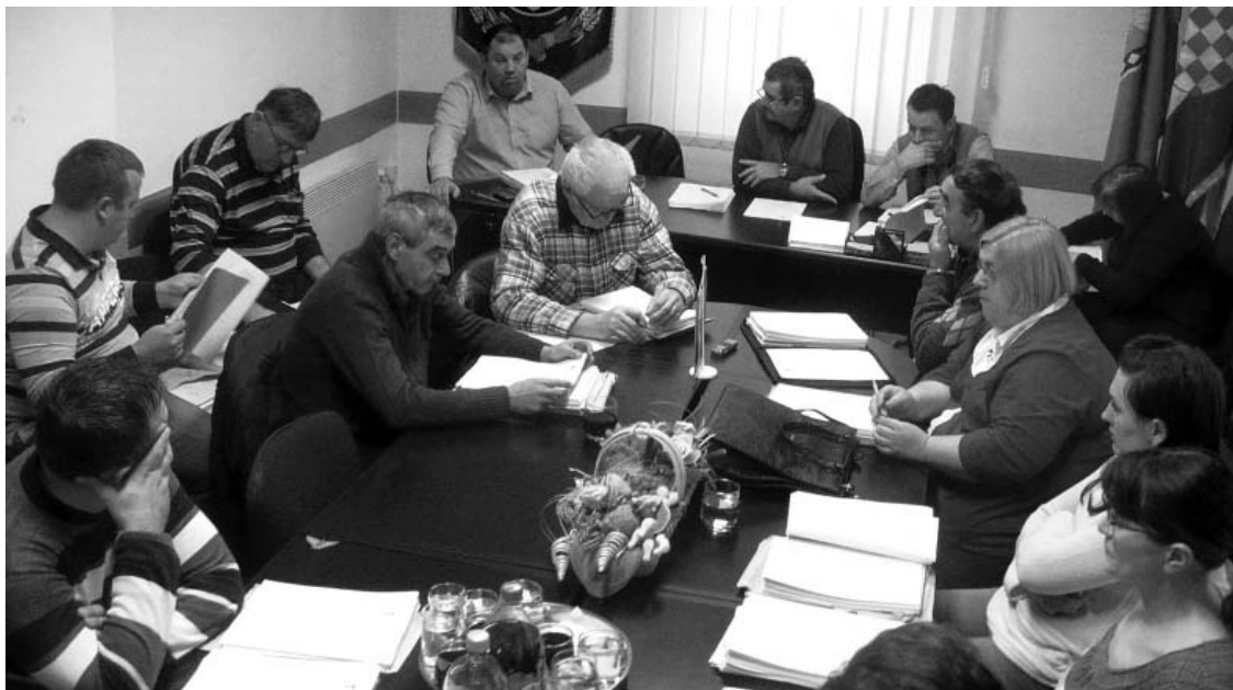
Općinski vijećnici raspravljali o brojnim životno značajnim temama

Osim proračunskih tema, općinski vijećnici su raspravljali