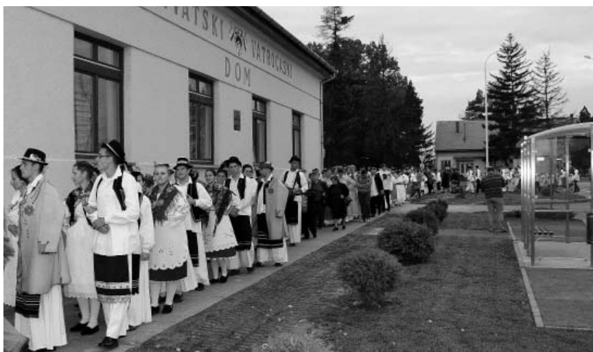
Duga kolona ovogodišnjih izvođača