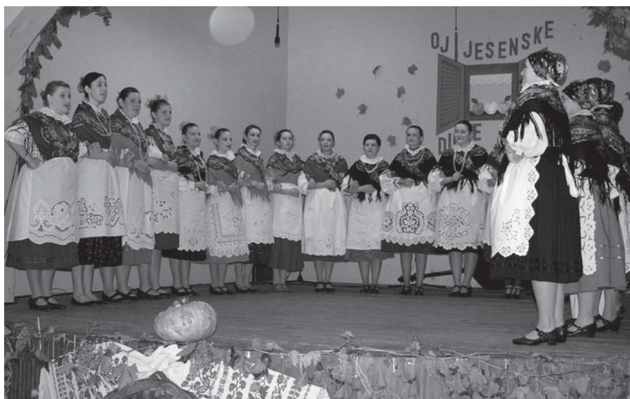
HKD Podgoračani u svom 23. nastupu