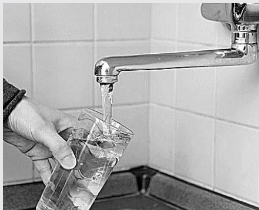
Nikad jeftiniji priključak i to još na rate

U Našičkom vodovodu se išli i korak dalje, pa su mještanima ponudili mogućnost obroč-