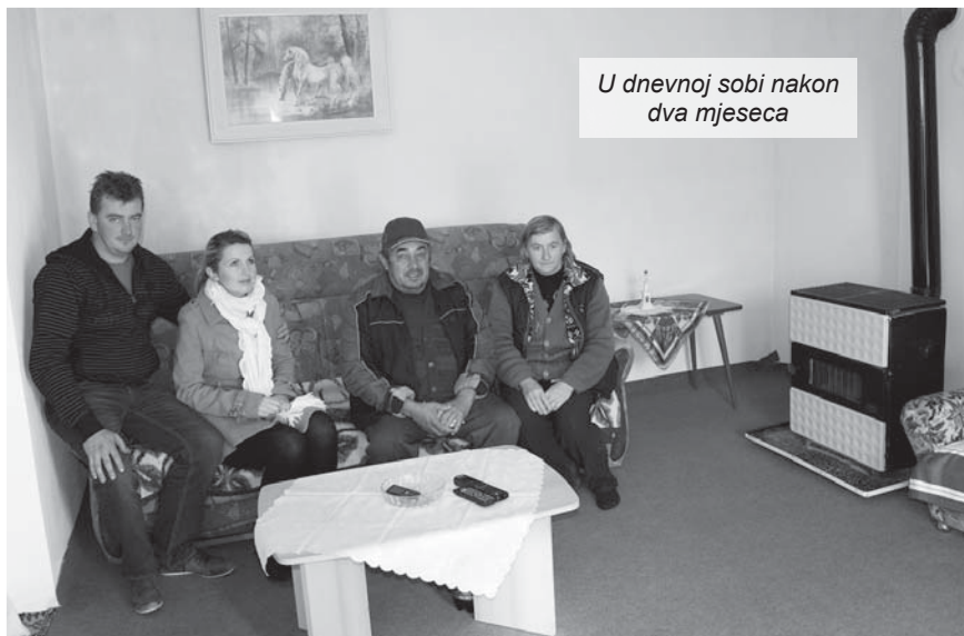
U dnevnoj sobi nakon dva mjeseca