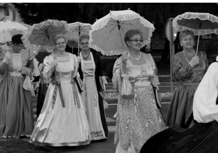
Šarenilo urbanog u ruralnom

Istovremeno, dokazani uspjeh ove manifestacije, uspjeh je i samog HKD-a Podgoračani, kao i čitave Općine Podgorač. Zbog svega toga, u osvit četvrtstoljetnog jubileja koji se očekuje 2015. godine, valjalo bi razmisliti ne samo o organiziranju velike fotodokumentacijske izložbe, nego i o pripremi i izdavanju prigodne monografije kojom bi se istovremeno obilježilo 25 godina manifestacije »Oj, jesenske duge noći«, ali i i djelovanja HKD-a Podgoračani.