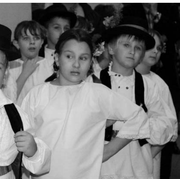
Podgoračka mladost jamči nastavak tradicije