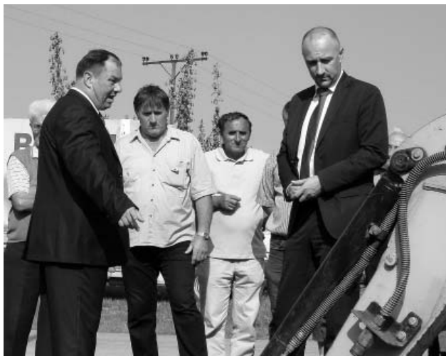
Razgovori s ministrom gospodarstva Ivanom Vrdoljakom, donijeli su brojne investicije