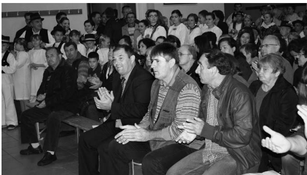
Prepuna dvorana podgoračkog Vatrogasnog doma