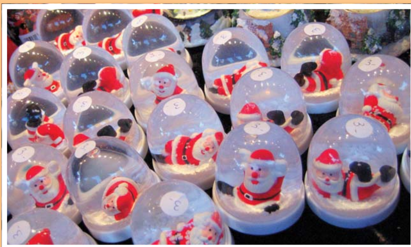
Komercijalizacija s početka 21. stoljeća

Djed Mraz, Djed Božić, Božić Bata ili Djed Božićnjak – kako li se sve