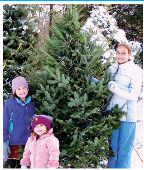
Obiteljska radost prilikom odabira božićnog drvca

U prošlogodišnjem božićnom izdanju našeg Informativnog lista, pisali smo o starim božićnim običajima podgoračkog kraja. Slične ili nešto specifičnije običaje pamti gotovo svako slavonsko selo. Međutim, ti su običaji prvenstveno vezani uz način života kakav je bio u našim krajevima prije mnogo desetljeća i, realno, teško ih je u praksi provoditi u današnje vrijeme. Dobro je što ostali zapisani i što na njih povremeno podsjećaju poneki školski učitelji, muzealci ili pak kulturno-umjetnička društva.