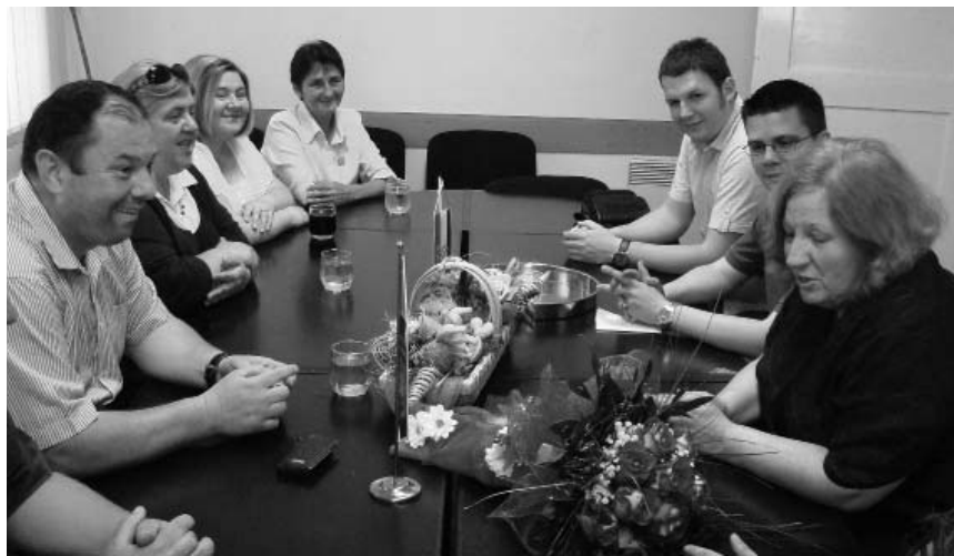
Ministrica kulture Andrea Zlatar Viočić suglasila se s budućim projektima za općinu Podgorač