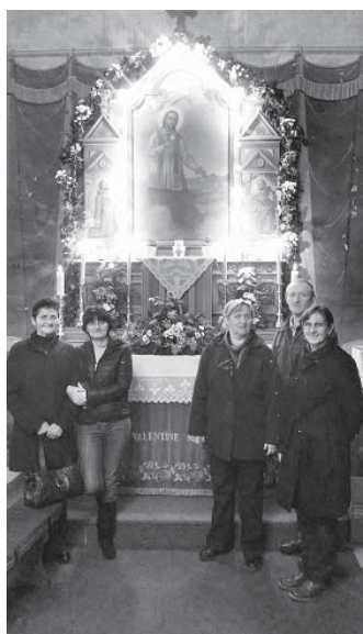
Vrijedna ekipa koja je okitila i uredila crkvu u novome ruhu

za nastup na regionalnoj smotri koja će se održati u Slavonском Brodu, a koja je ujedno najviša stepenica natjecanja. Važno je pohvaliti sva društva i zahvaliti na njihovom trudu očuvanja naše kulturne baštine.