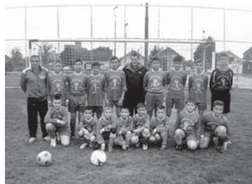
Pioniri Sloge jedina su općinska momčad u ovom rangu natjecanja