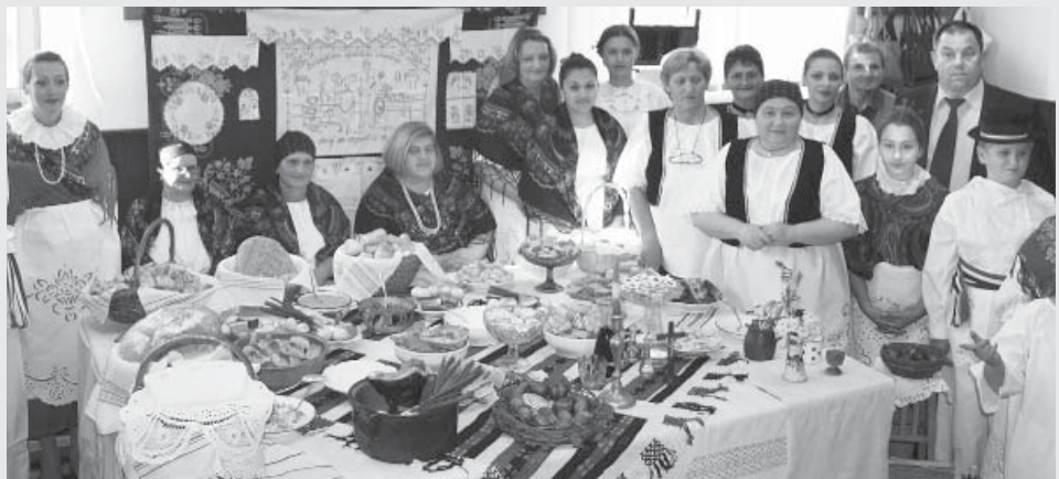
S prošlogodišnjeg Uskršnjeg stola u Podgoraču

Naravno, svi koje zanimaju tradicionalni uskrсни običaji naših sela, a osobito delicije koje su pripremane i servirane na uskršnjim stolovima – dobrodošli su na ovogodišnji 8. Uskrсни stol u Podgoraču.