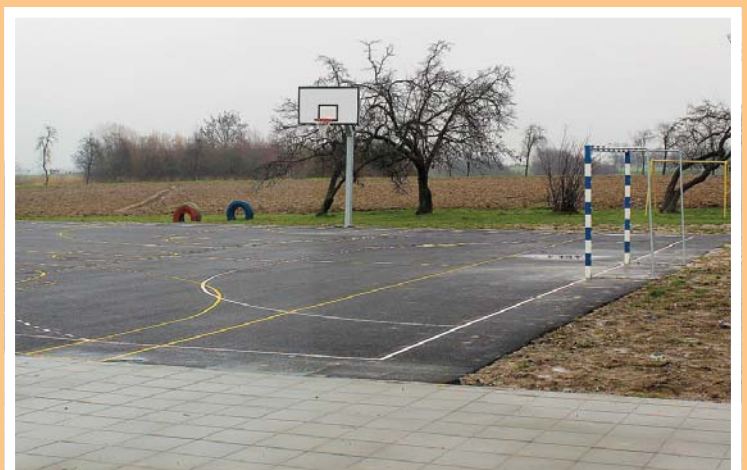
I vanjska igrališta su nova i spremna za prave proljetne dane