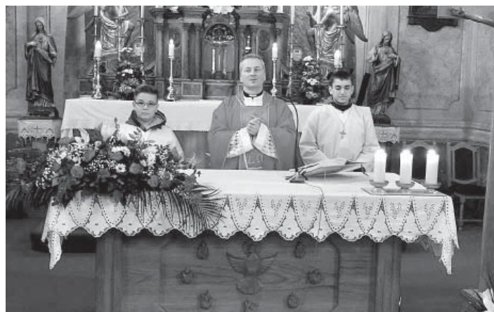
Svečano misno slavlje