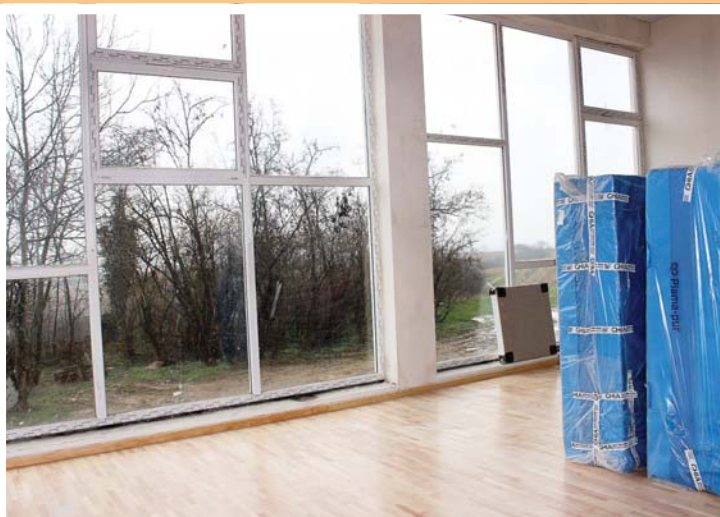
Spreme su i gimnastičke strunjače u maloj dvorani