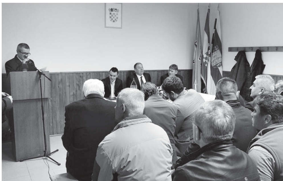
Svečana sjednica podgoračkog Općinskog vijeća

- Završili smo ili pokrenuli niz projekata i investicija. Izravno iz proračuna su izdvojena znatna sredstva za izradu projektnih dokumentacija koje će biti podloga