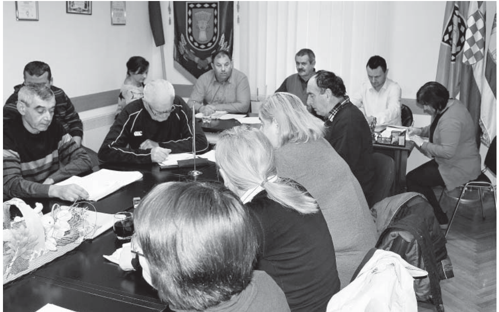
Na prvoj ovogodišnjoj sjednici općinski vijećnici usvojili niz odluka o programima javnih potreba

Također, misli se i na mlađu populaciju, pa je tako za stipendiranje studenata izdvojeno 72 tisuće kuna, a za troškove prijevoza učenika daljnjih 70 tisuća kuna. Odlukom općinskih vijećnika, i dalje će se nastaviti isplaćivati naknade za novorođenčad za što je u općinskog proračunu rezervirano 40 tisuća kuna.