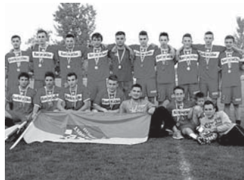
Prošlosezonski sastav juniora Mladosti bukvalno je 'žario i palio' čitavu sezonu