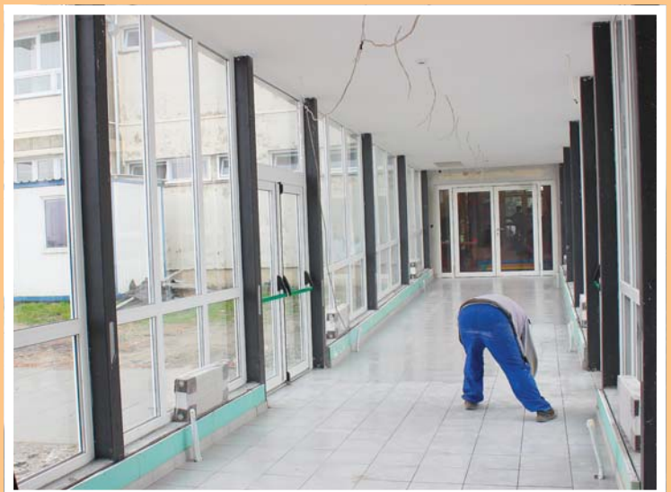
Ostakljeni i zagrijani tunel između škole i dvorane