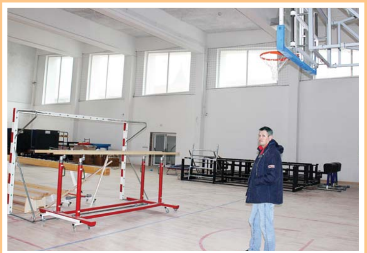
Tu su i montažne tribine