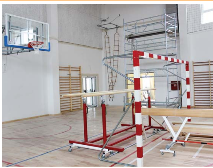
Oprema je stigla i montirana