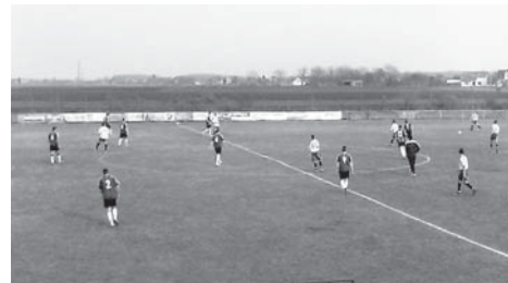
Seniorska ekipa NK Poganovci imala je dobre rezultate u pripremnom razdoblju, ali službeni proljetni početak nije bio uspješan